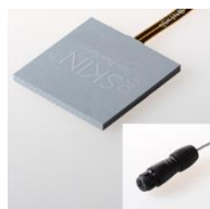
gSKIN ® -XO 67 7C